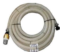
KIT ASPIRATION 7M Ø 20MM MALE 1" AVEC CREPINE A CLAPET