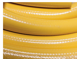
TUYAU ARROSAGE - COURONNE 25M DIAMETRE INTERIEUR - 20 MM