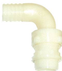
COUDE 3 PIECES CANNELE NYLON MALE 1" x 20