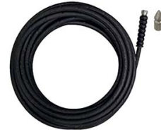
KIT DEBOUCHAGE DE CANALISATION AVEC FLEXIBLE HP 20M