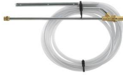
KIT DE SABLAGE CALIBRE 045 MALE EURO