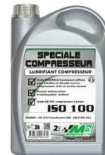
HUILE POUR POMPE HP BIDON DE 2L