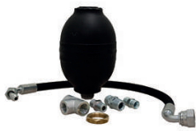
KIT ANTI COUP DE BELIER POUR NETTOYEUR HAUTE PRESSION