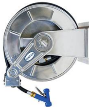
ENROULEUR INOX BASSE PRESSION EQUIPE FLEXIBLE 25M 25L/MIN