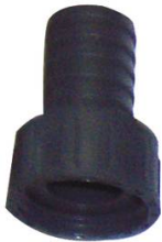
MANCHETTE CANNELEE PP FEMELLE 3/4" x 20