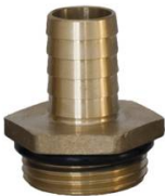
RACCORD CANNELE LAITON MALE 1" x 20