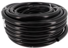
COURONNE 25M TUYAU SOUPLE PVC 20 BARS DIAMETRE 20