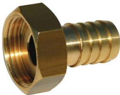
MANCHETTE CANNELEE LAITON ECROU TOURNANT F1" x 20