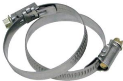
COLLIER DE SERRAGE W4 TOUR ET VIS EN INOX DIAMETRE 20-32