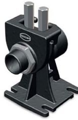
PIED D'ASSISE TYPE B