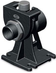
PIED D'ASSISE TYPE A