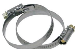
COLLIER DE SERRAGE W4 TOUR ET VIS EN INOX DIAMETRE 20-32