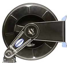
ENROULEUR INOX POUR ADBLUE EQUIPE FLEXIBLE 10M EN 3/4"