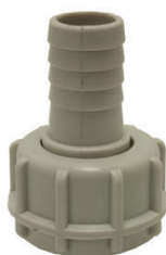
RACCORD CANNELE PP Ø 20MM FEMELLE 1"