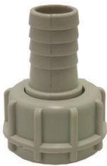
RACCORD CANNELE PP Ø 20MM FEMELLE 1"