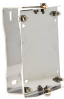
SUPPORT MURAL PIVOTANT POUR ENROULEUR INOX