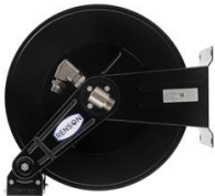
ENROULEUR AUTOMATIQUE ACIER NU CAPACITE MAX 10M EN 3/4"