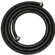
FLEXIBLE REFOULEMENT ADBLUE 4M RENFORCE Ø 20MM